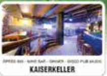
APRES-SKI - WINE BAR - SNACK - DISCO PUB MUSIC KAISERKELLER