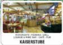
RESTAURANTE - PIZZERIA - GRILL LOUNGE & WINE BAR - CAFE - PUB KAISERSTUBE