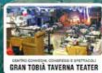
SEMINO CONFERE, CONGRESSI E SPETTACOLI GRAN TOBIA TAVERNA TEATER