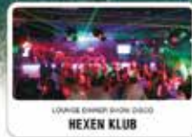
LOUNGE DINNER SHOW DISCO HEXEN KLUB