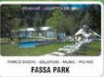
THEATRO LIQUORIUM PARCO GIOCHI - SOLARIUM - MUSIC - FITNESS FASSA PARK