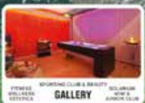
FITNESS WELLNESS ESTERNA SPORTING CLUB & BEAUTY GALLERY SOLARIUM SPA & JACUZZI CLUB